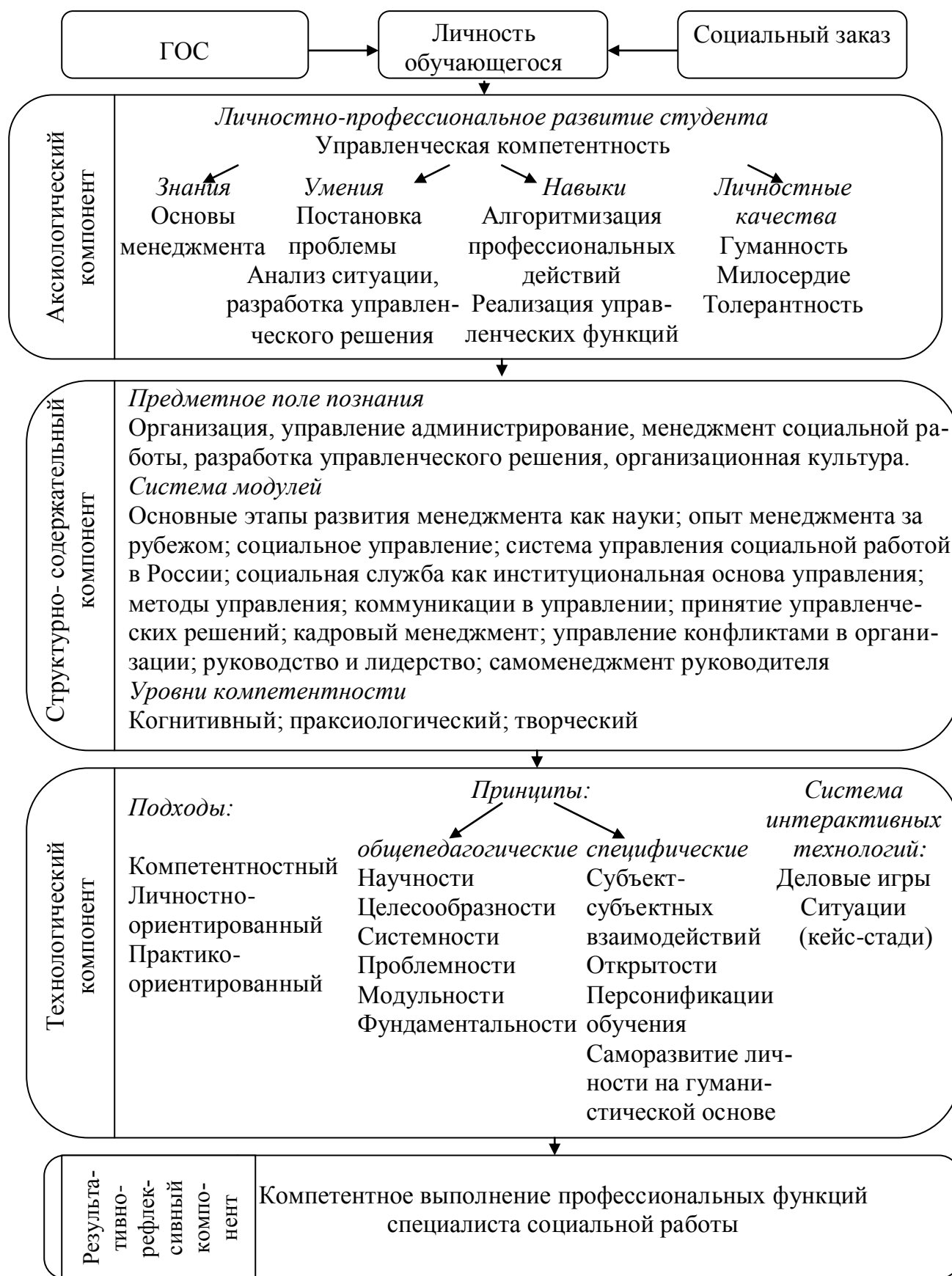
Рис. 1. Структурно-содержательная модель подготовки студентов к полифункциональной социально-управленческой деятельности