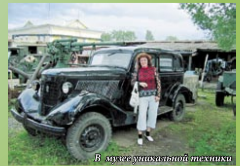
В музее уникальной техники