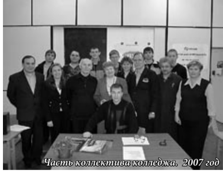
Часть коллектива колледжа. 2007 год

Тысячи выпускников с горящими глазами вспоминают свои юношеские или зрелые годы, проведенные в техникуме, в колледже. Во многих семьях сложилась традиция — проходить школу жизни в машиностроительном