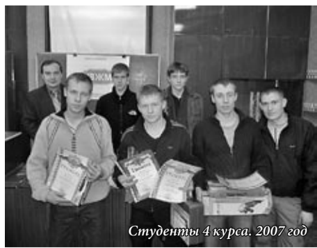
Студенты 4 курса. 2007 год