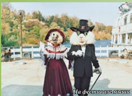
На фестивале мыши

По легенде мышь разбудила князя-владельца слободы, когда ему грозила опасность и спала его от смерти, повелев граду Мышкину быть!