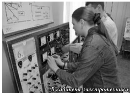
В кабинете электротехники