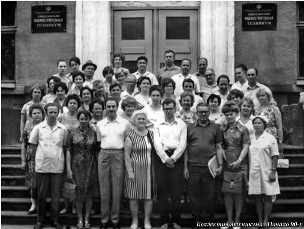
Коллектив техникума. Начало 90-х

Многие рабочие пришли в техникум получить современные рабочие профессии. Молодые преподаватели обучали студентов — будущих передовиков завода-великана. Техникум не только вёл подготовку высококвалифицированных специалистов, но и воспитывал культурных и образованных членов общества. За все годы своего