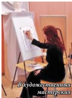
В художественных мастерских