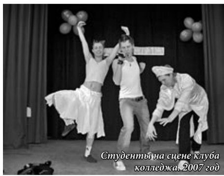
Студенческая сцена клуба колледжа. 2007 год