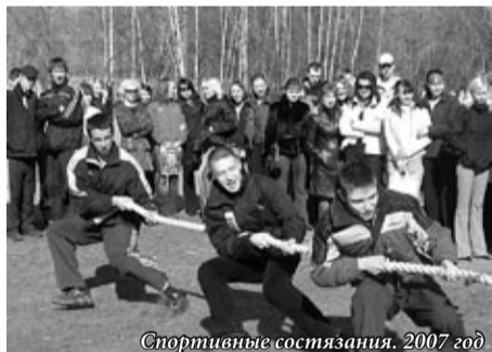
Спортивные состязания. 2007 год