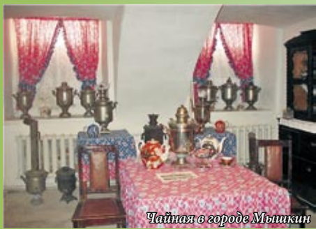
Чайная в городе Мышкин