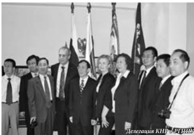
Делегация КНР в РГПУ

Открывшаяся Школа Конфуция стала первым и единственным в городе учебным заведением, где преподают жители Китая – филологи и лингвисты, свободно владеющие русским языком.