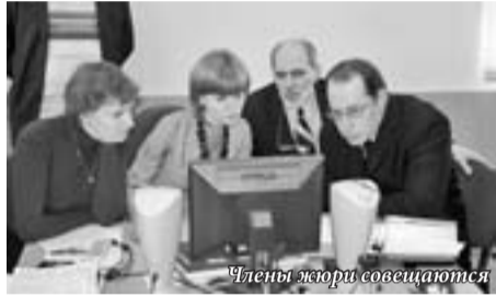
Члены жюри совещаются

В конкурсе приняли участие студенты кафедры Технологии машиностроения МАИ РГППУ и студенты Екатеринбургского машиностроительного колледжа в составе МАИ. В качестве почетных гостей конкурса присутствовали учащиеся лицея «Уралмашевец» (г. Верхняя Пышма).