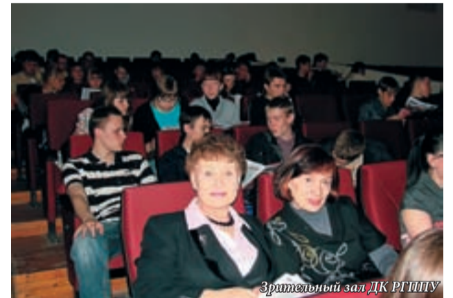
Зрительный зал ДК РГПУ