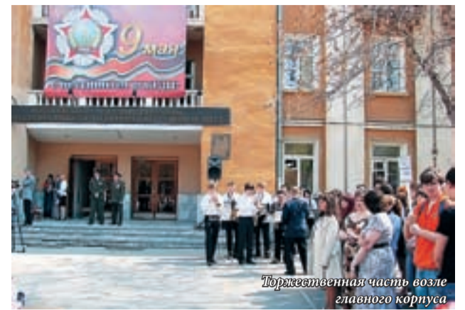
Торжественная часть возле главного корпуса