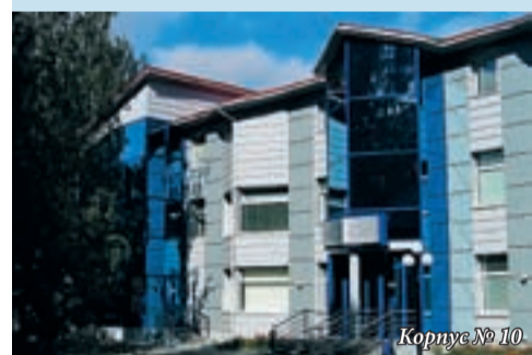
Корпус № 10

Главный учебный корпус (№ 0), корпуса № 1, 2, 7, 8 ул. Машиностроителей, 2, 11 Проезд: метро ст. «Уралмаш», троллейбус 8, 10, 17, трамвай 5, 24, автобус 56, 33, 36, остановка «Площадь 1-ой Пятилетки»