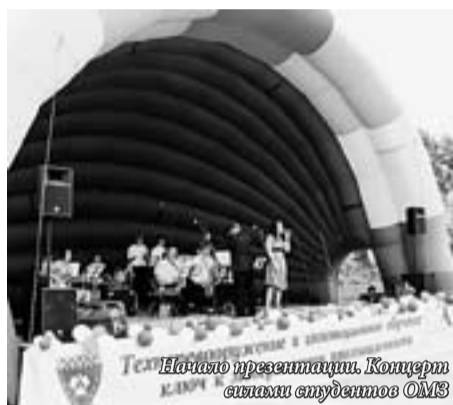
Начало презентации. Концерт силами студентов ОМС