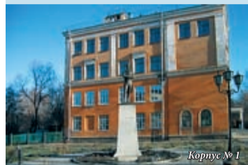
Корпус № 1