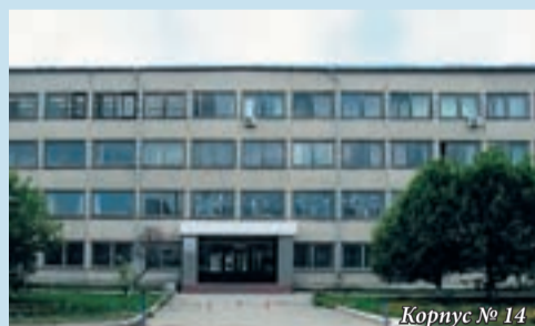
Корпус № 14

Корпуса № 11, 12 ул. Машиностроителей, 9 (Екатеринбургский машиностроительный колледж) Проезд: метро ст. «Уралмаш», троллейбус 8, 10, 17, трамвай 5, 24, автобус 56, 33, 36 остановка «Площадь 1-ой Пятилетки»