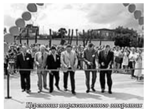
Церемония торжественного открытия

Такого учебного центра больше нет в России. У корпорации «ПУМОРИ-СИЗ» есть еще несколько центров, но наш действительно уникален.