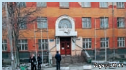
Корпус № 11

Корпуса № 11, 12 ул. Машиностроителей, 9 (Екатеринбургский машиностроительный колледж) Проезд: метро ст. «Уралмаш», троллейбус 8, 10, 17, трамвай 5, 24, автобус 56, 33, 36 остановка «Площадь 1-ой Пятилетки»