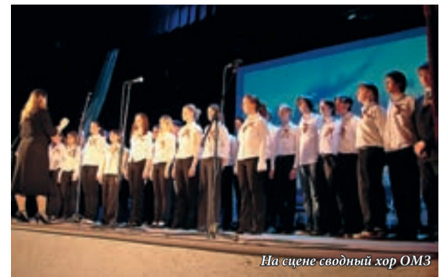
На сцене сводный хор ОМЗ