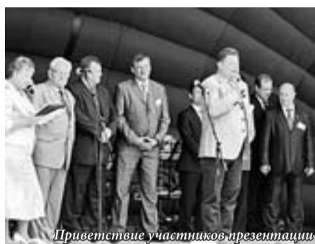
Приветствие участников презентации

16 июня в РГПУ уральские промышленники и представители образования обсудили проблемы подготовки кадров на «круглом столе», организованном в рамках презентации учебно-демонстрационного центра технологий машиностроения.