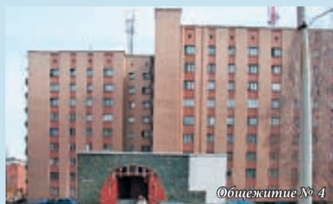
Общежитие № 4

Корпус № 9, общежития № 4, 5 ул. Ильича, 26 Проезд: троллейбус 10, остановка «Библиотека»