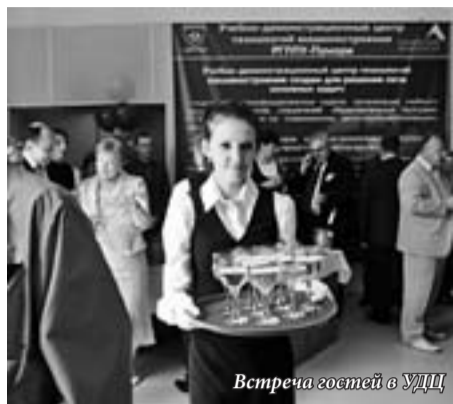
Встреча гостей в УДЦ

В начале лета в нашем вузе открылся учебно-демонстрационный центр, созданный совместно с корпорацией «ПУМОРИ-СИЗ». Кого и чему будут обучать на новейшем оборудовании Центра?