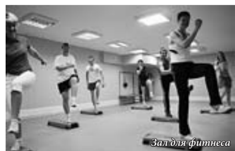
Зал для фитнеса

За летние месяцы, которые я проработал в университете, успел познакомиться с руководством СоИн, преподавателями профилирующих кафедр СоИн, руководителями и специалистами финансового и планово-экономического управлений университета, хозяйственного управления, управления эксплуатации коммуникаций и технического содержания основных фондов, службы безопасности, социально-экономического и юридического отделов, управления автоматизации и информатизации, управления документирования капитальных затрат. Хочу подчеркнуть, что первые впечатления обо всех без исключения новых коллегах по работе самые позитивные.