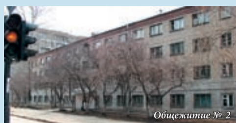
Общежитие № 2

Корпус № 9, общежития № 4, 5 ул. Ильича, 26 Проезд: троллейбус 10, остановка «Библиотека»