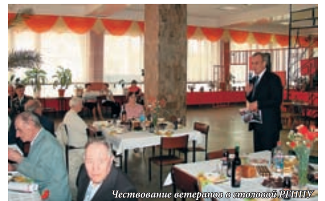
Чествование ветеранов в столовой РГПУ