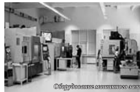
Оборудование машинного зала

ники, они пользуются большим спросом на международном рынке. Обновлять оборудование планируем раз в год – полтора. Технологически центр продуман так, что станки легко убираются и ставятся новые.