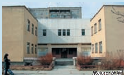
Корпус № 15

Корпуса № 13, 14 ул. Таганская, 75, 75а (Екатеринбургский электромеханический колледж) Проезд: троллейбус 13, 16, остановка «Таганская»