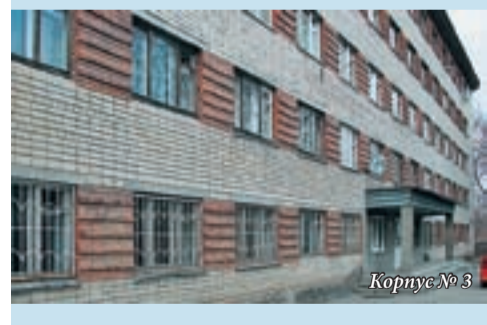
Корпус № 3

Корпус № 10 ул. Луначарского, 85а Проезд: трамвай 2, 3, 8, 14, 20, 25, 26, остановка «Шевченко»