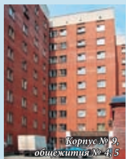
Корпус № 9, общежития № 4, 5

Корпуса № 3, 4, 5, 6 ул. Каширская, 73 Проезд: троллейбус 13, 16, остановка «Таганская»