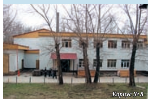
Корпус № 8

Общежитие № 2 ул. Индустрии, 55 Проезд: троллейбус 10, 13, остановка «Индустрии»