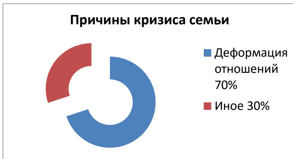
Рисунок 2. 70% опрошенных ответили, что кризис семьи вызван деформацией внутрисемейных отношений

Наблюдается закономерность, что люди, которые всерьёз переживают за духовное здоровье своих детей, кто задумывается о внутрисемейных отношениях, о психическом здоровье своих родных, как раз наблюдают этот кризис и в основном считают, что он вызван неправильным пониманием брака и деформацией внутрисемейных отношений (70% опрошенных).