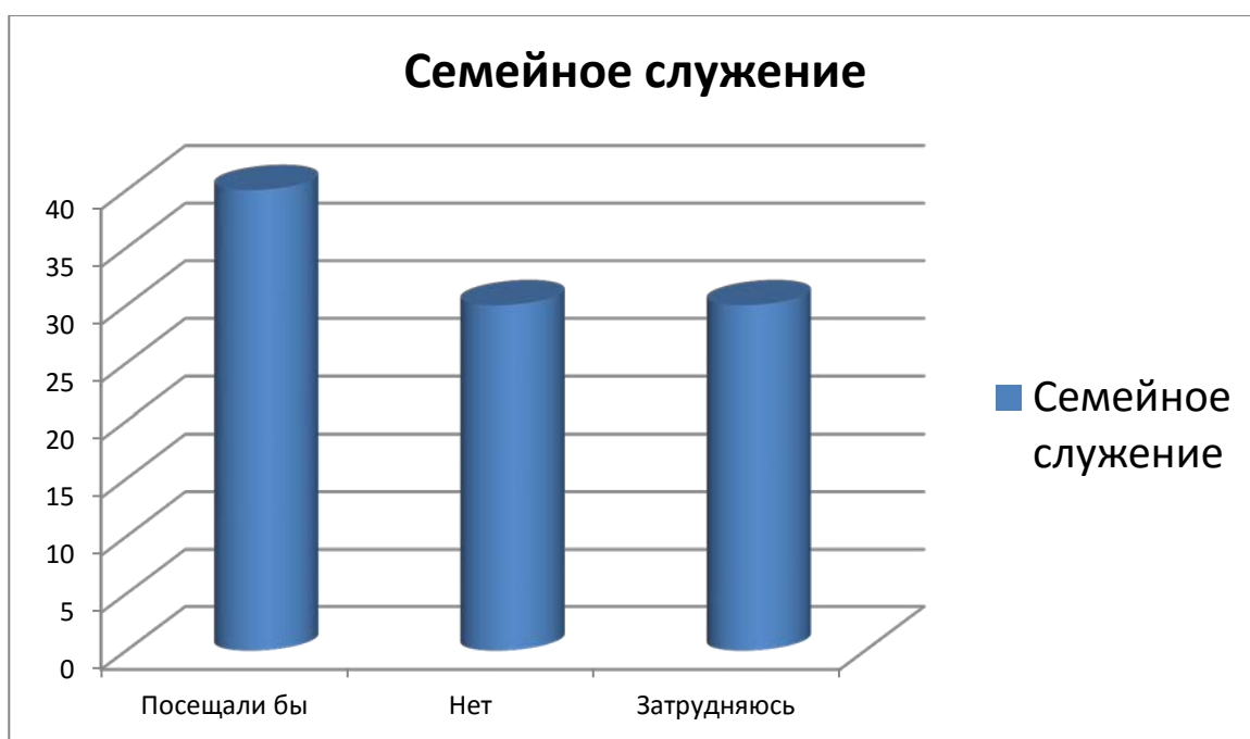
Рисунок 3. Семейное служение посещали бы 40% опрошенных семей; 30% -не посещали бы; столько же затрудняются ответить

В последних вопросах анкеты также были задеты вопросы о рентабельности внутрицерковного семейного служения сегодня. 90 % респондентов считают, что духовная поддержка молодых семей необходима! При этом лишь 30% бы посещали подобные занятия. 30% затрудняются дать ответ на поставленный вопрос, и 40% уверены, что не стали бы посещать встречи со служителями.