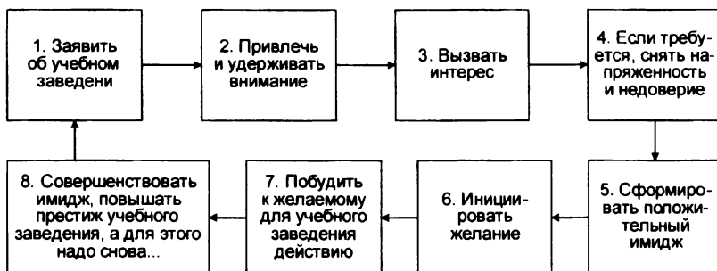
Рис. 2. Социально-психологический аспект деятельности службы по связям с общественностью по формированию имиджа учебного заведения (по А. П. Егоршину в интерпретации А. В. Ефанова)

Не менее приоритетным направлением в работе службы по связям с общественностью является внутриорганизационный PR , который направлен на поддержание продуктивных отношений внутри образовательного учреждения, на взаимодействие с его преподавателями, сотрудниками и обучающимися. Основное предназначение внутренней PR -деятельности заключается в формировании у преподавателей и обучающихся чувства ответственности, заинтересованности и сопричастности в делах учебного заведения и в действиях администрации.