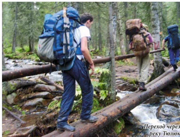
Переход через реку Тюлюк

Уже третий год не можем найти заброшенную деревню и речку с одноимённым названием, где мы вставали на ночлег. Немного успокоили нас местные охотники, которые сказали, что в про-