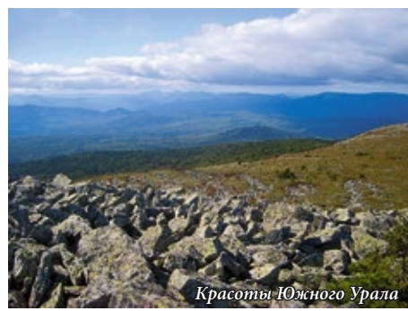
Красоты Южного Урала