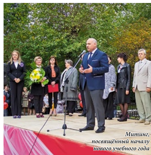
Митинг, посвященный началу нового учебного года