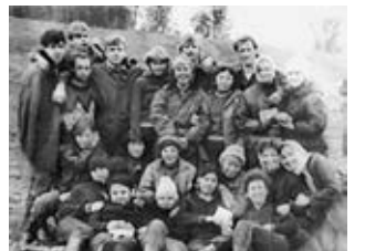
Сентябрь 1986 г., группа Э-542.

Явно необходимо было механизировать некоторые виды работ, питание должно было быть лучше, бытовые условия комфортнее, т.д., и т.п. В отчёте о работе СИПИ за 1989 г. в разделе «Предложения по перестройке» (с.83–84) читаем: «3. Требуется взвешенного подхода отношение к сельхозработам. Есть регионы (типа Свердловской области), которые на многие годы обречены на эти работы, т.к. численность сельского населения в них менее 10%... По этой причине и по причинам нравственного плана (уборка урожая – общее дело) вузам Свердловска нельзя отказываться от участия в сельхозработах. В связи с этим целесообразно дать вузам право официального начала учебного года с 1 октября...»