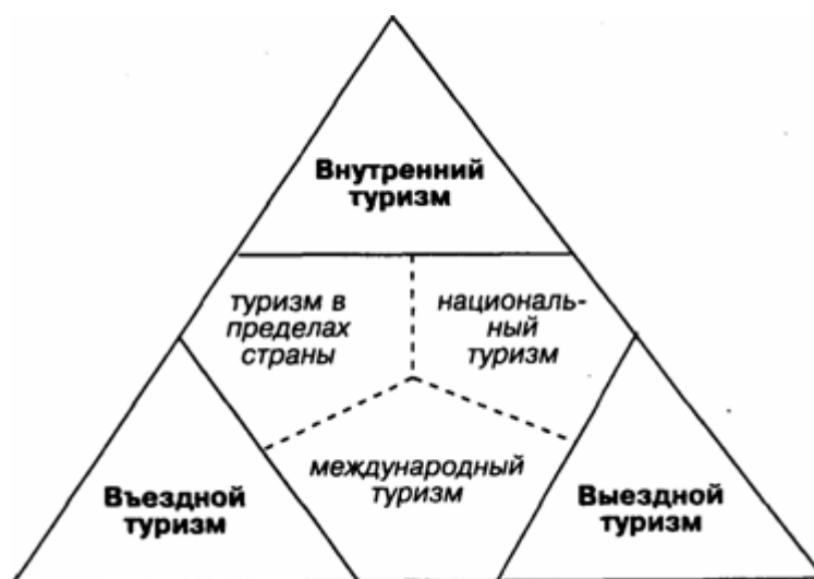
Рисунок 1.1 Категории туризма

Указанные выше классификации туризма могут по-разному сочетаться между собой, образуя следующие категории туризма (Рисунок 1.1)