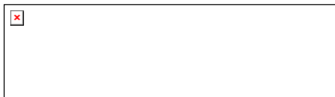
Рис. 4. Разрешение противоречия между особенными содержаниями, исходя из их единого основания

способ разрешения такого противоречия является, на наш взгляд, руководством для разрешения противоречий и в иных областях знания и жизни: разрешение противоречий между особенными содержаниями возможно на основе их единого основания. Представим это схематично (рис. 4).