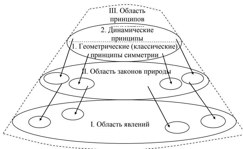
Рис. 1. Схема деления области научных знаний согласно Е. Вигнеру

при зеркальном отражении относительно биссектрисы угла, лежащего между равными сторонами, сохраняет свой вид; также и правильный шестиугольник при повороте на угол, кратный 60^\circ , остается неизменным. Это свидетельствует о симметрии указанных фигур относительно соответствующих преобразований.