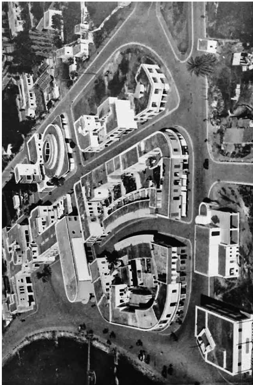
Рис. 1. Центр города Португала, вид с самолета, 1936 г.