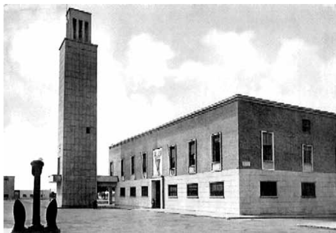
Рис. 4. Сабудия