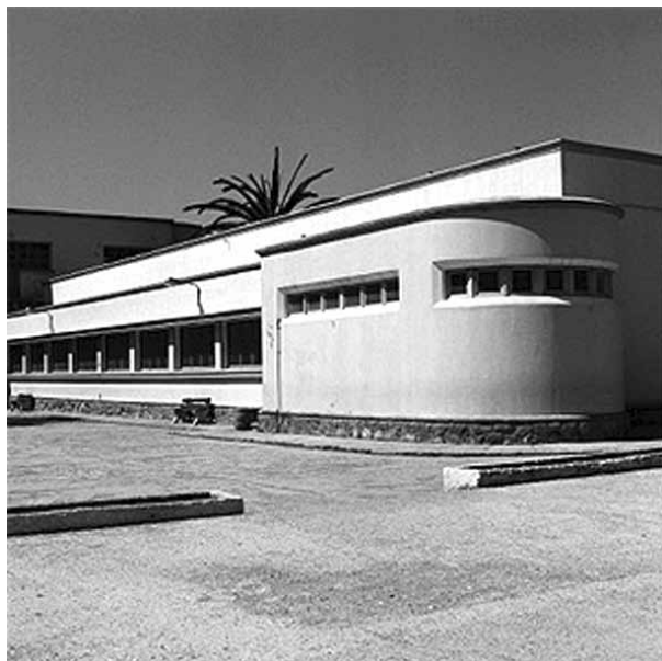
Рис. 3. Школа в городе Портогалео