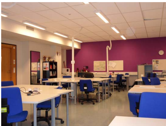
Фото. Учебный класс университета прикладных наук Laurea.

Для эффективного обучения в Laurea созданы рабочие места (проектные офисы) для каждого студента, оборудованные всем необходимым – от персонального компьютера до индивидуального комплекта посуды, фирменного портфеля и др. немаловажных вещей, способствующих эффективной работе над проектом (Фото 1). Студенты работают в команде под присмотром преподавателей – консультантов (специалистов в своей области). По определению проектный офис — это временное организационное образование, предназначенное для реализации функций проектного управления.