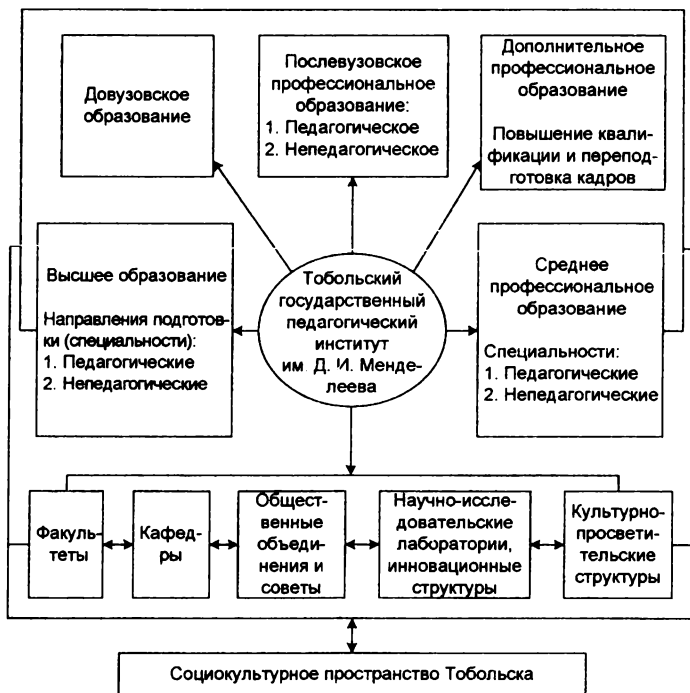
Рис. 3. Влияние образовательной деятельности вуза на социокультурное пространство малого города

На рис. 3 показаны возможности влияния образовательной деятельности вуза на потребности города и региона в кадрах как через широкий спектр направлений подготовки (специальностей), так и через системы дополнительного профессионального образования, повышения квалификации и переподготовки кадров, послевузовского профессионального образования.