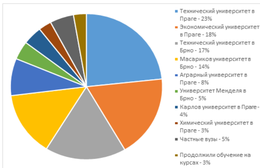
Рис. 2. Распределение студентов по ВУЗам Чешской республики в 2016 году

Поступившие студенты распределились по университетам следующим образом: