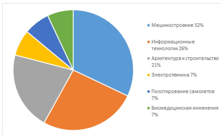
Рис. 3. Распределение студентов по факультетам Технического университета в Праге

Из поступивших в ЧВУТ большинство (32%) станут студентами Машиностроительного факультета, по 26% - студентами факультетов Информационных технологий, 21% - студентами Строительного факультета (специальность Архитектура), по 7% студентов станут изучать Биомедицинскую инженерию, Пилотирование самолетов и Электротехнику.