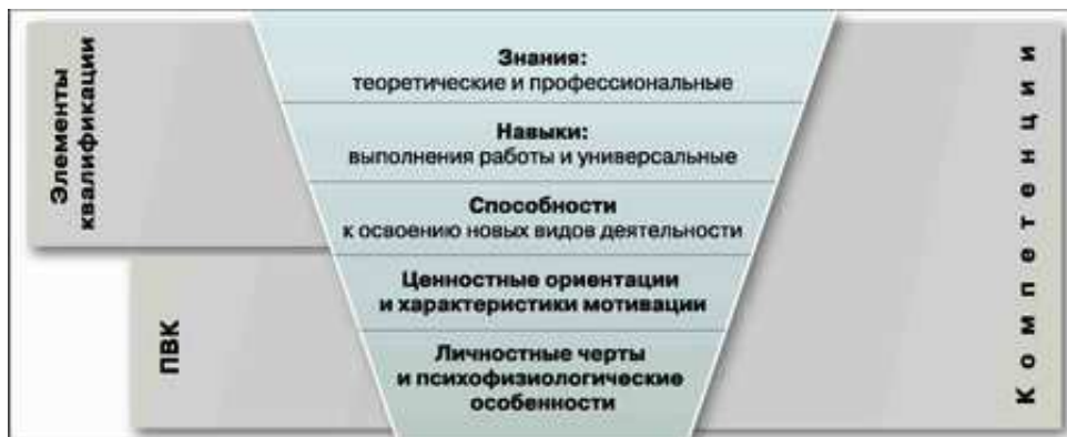
Рис. 2. Соотношение видов характеристик, используемых для оценки персонала [2]

При анализе структуры компетенций (рис. 2) в HR-менеджменте особо отмечается тот факт, что содержательно понятие «компетенция (единичная)» не несет в себе ничего принципиально нового.