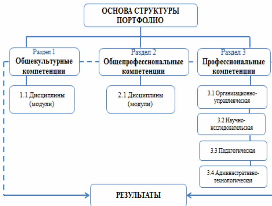
Рис. 1. Авторская модель «Основа структуры электронного профессионально ориентированного портфолио обучающегося по направлению подготовки 38.04.04 «Государственное и муниципальное управление (уровень магистратуры)»

структуру электронного учета их достижений, на базе которой выпускники за годы обучения сформируют свой «портфель», отображающий, главным образом, результаты освоения образовательной программы, т. е. сформированность необходимых потенциальным работодателям компетенций.