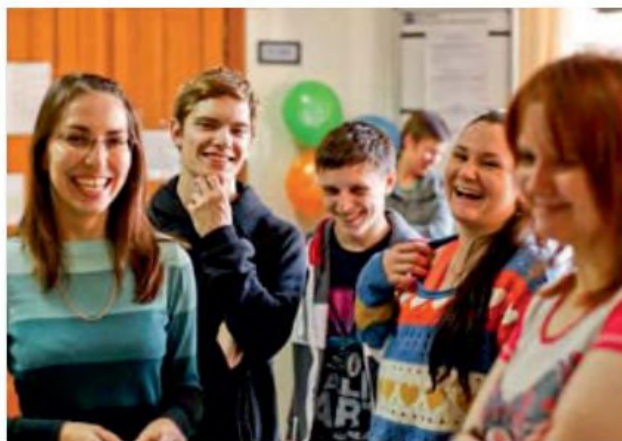
Первокурсники Института ППО, 2015 год