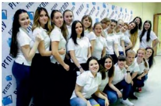
Мероприятие «Интуиция» для первокурсников, декабрь 2015 г.