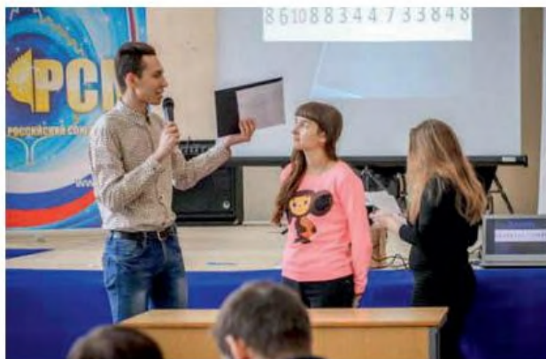
РСМ РГППУ участники «Интуиции», декабрь 2015 г.

за значимые аспекты, волей-неволей учишься не сдаваться, искать новые выходы из ситуаций, результативно решать проблемы. Мне нравится эта взаимность: мы работаем на организацию, а она, в свою очередь, на нас. Каждый участник не ограничен рамками и занимает должность по душе. Достойные проекты наших ребят отправляются на различные конкурсы, сами они пробуют себя в роли режиссеров массовых мероприятий, ведущих, дизайнеров, «прокачиваются» на тренинг-площадках, занимаются рекламными акциями, и даже это далеко не все.