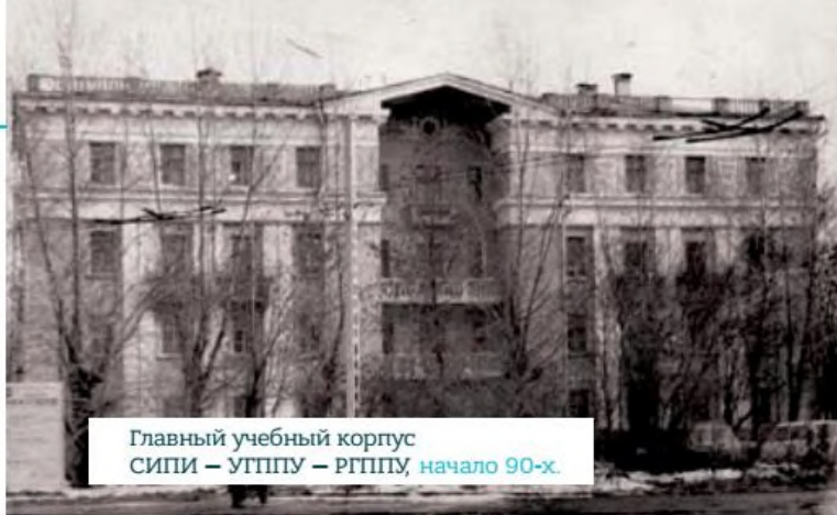
Главный учебный корпус СИПИ – УГППУ – РГППУ, начало 90-х.