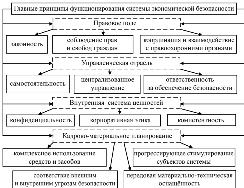
Рис. 1. Совокупность принципов функционирования негосударственной системы обеспечения безопасности предпринимательской деятельности

4) комбинация из нескольких выше представленных базовых вариантов, которая предполагает использование собственной службы безопасности совместно с государственными и / или негосударственными структурами, которые предоставляют услуги по обеспечению безопасности.