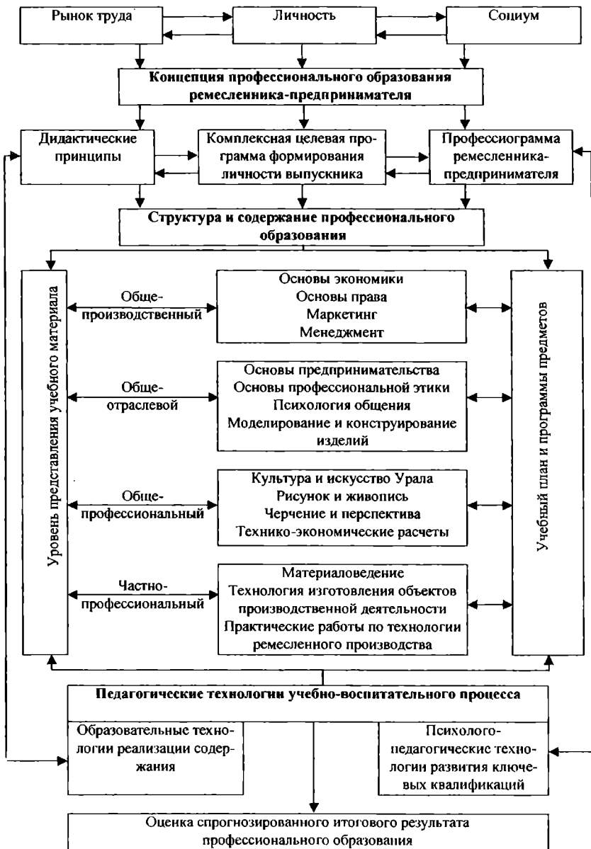
Рис. 2. Модель образовательной деятельности лица