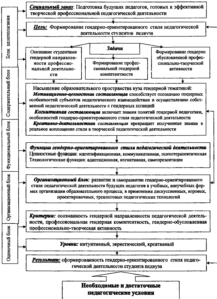
Рис.1. Структурно-функциональная модель формирования гендерно-ориентированного стиля деятельности студентов педвуза