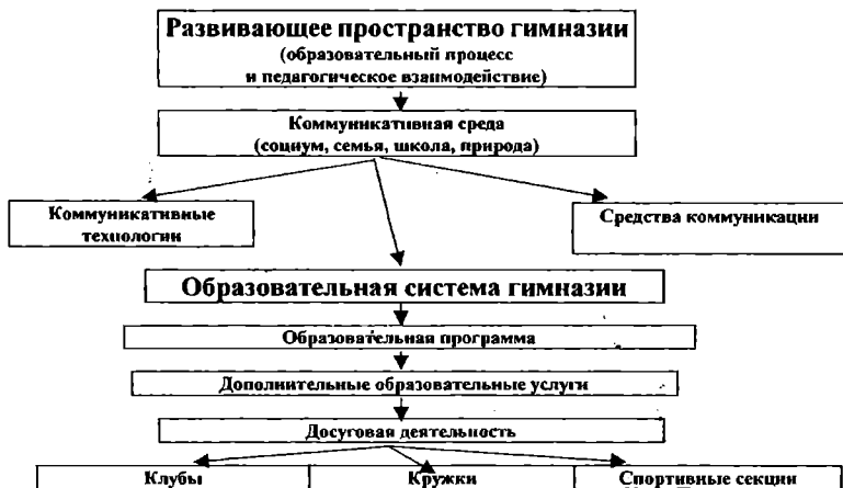
Рис. 3. Развивающее пространство гимназии

Формальная иерархия коллектива гимназии превращается в многоуровневую систему связей, где наряду с централизмом – в зависимости от ситуации – уместны патернализм и совместная опека. Здоровый корпоративный дух присутствует в гимназии и подчеркивает индивидуальность и творческое начало.