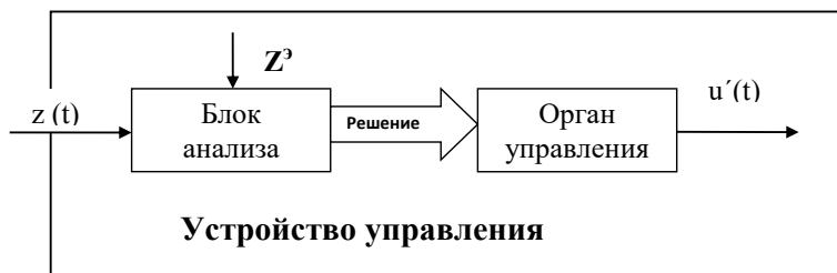
Рис. 3. Структура управляющего устройства

Для выработки корректирующего воздействия и его реализации управляющее устройство должно содержать блок анализа и орган управления (рис. 3). В блоке анализа определяется рассогласование e(t) = z_k - z_k^3 , по величине которого вырабатывается решение. Следует иметь в виду, что в управлении сложными системами в обязательном порядке должна присутствовать неоднозначность выбора управляющего воздействия, позволяющая найти для данной ситуации наиболее рациональное решение.