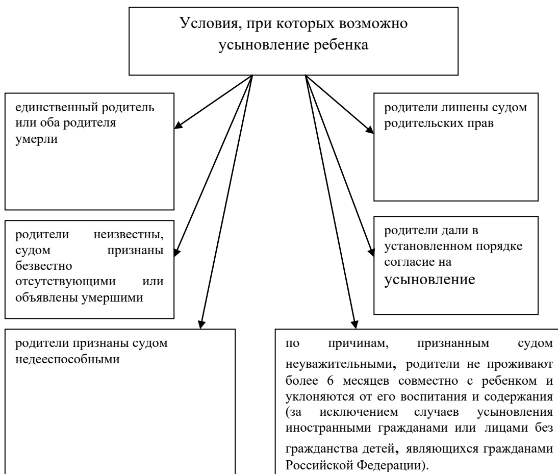
Схема 1. Необходимые условия для усыновления ребенка.