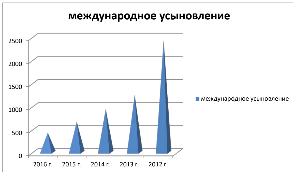
Рисунок 1. Международное усыновление в 2012-2016 гг..)

С каждым годом уменьшается количество дел о международном усыновлении. Это можно увидеть на рисунке 1.