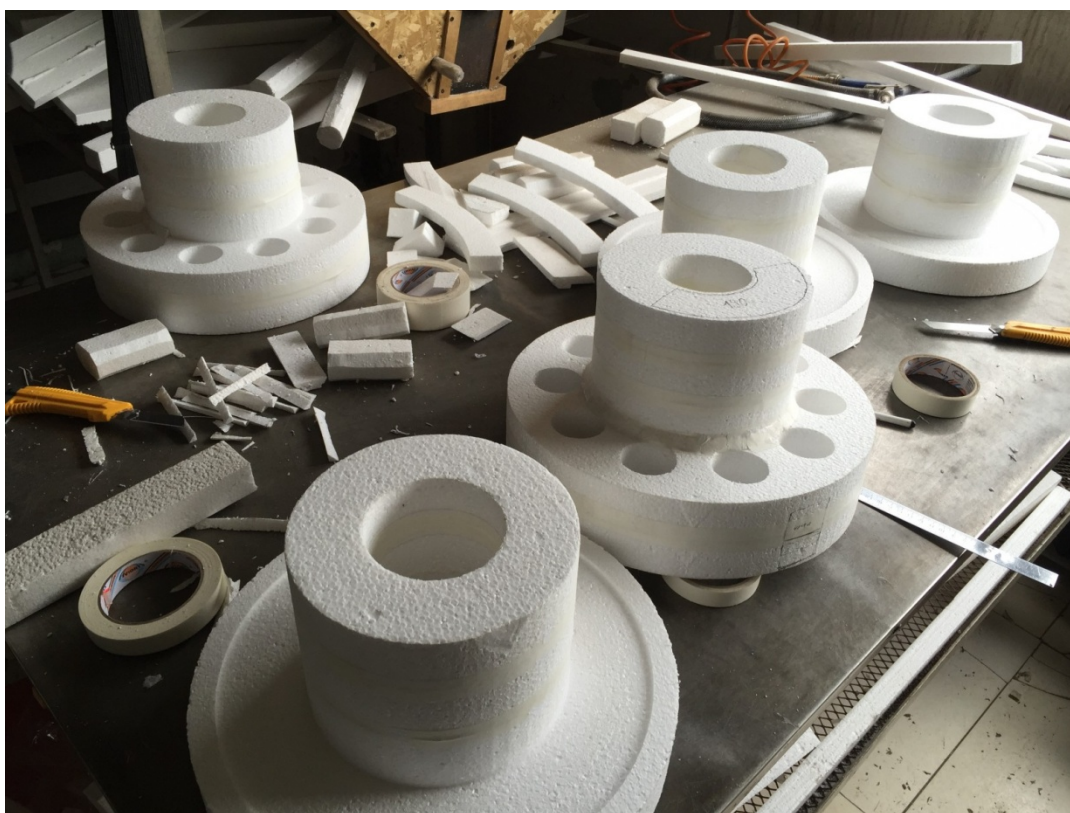
Рисунок 3 – Пенополистироловые модели

На рисунке 3 представлены пенополистироловые модели, которые в дальнейшем будут соединяться в модельные кусты.