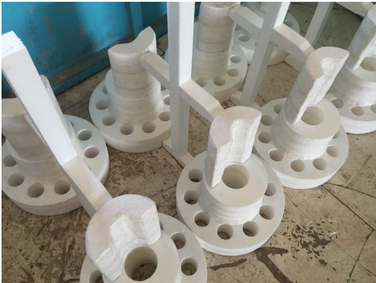
Рисунок 4 – Модельные кусты