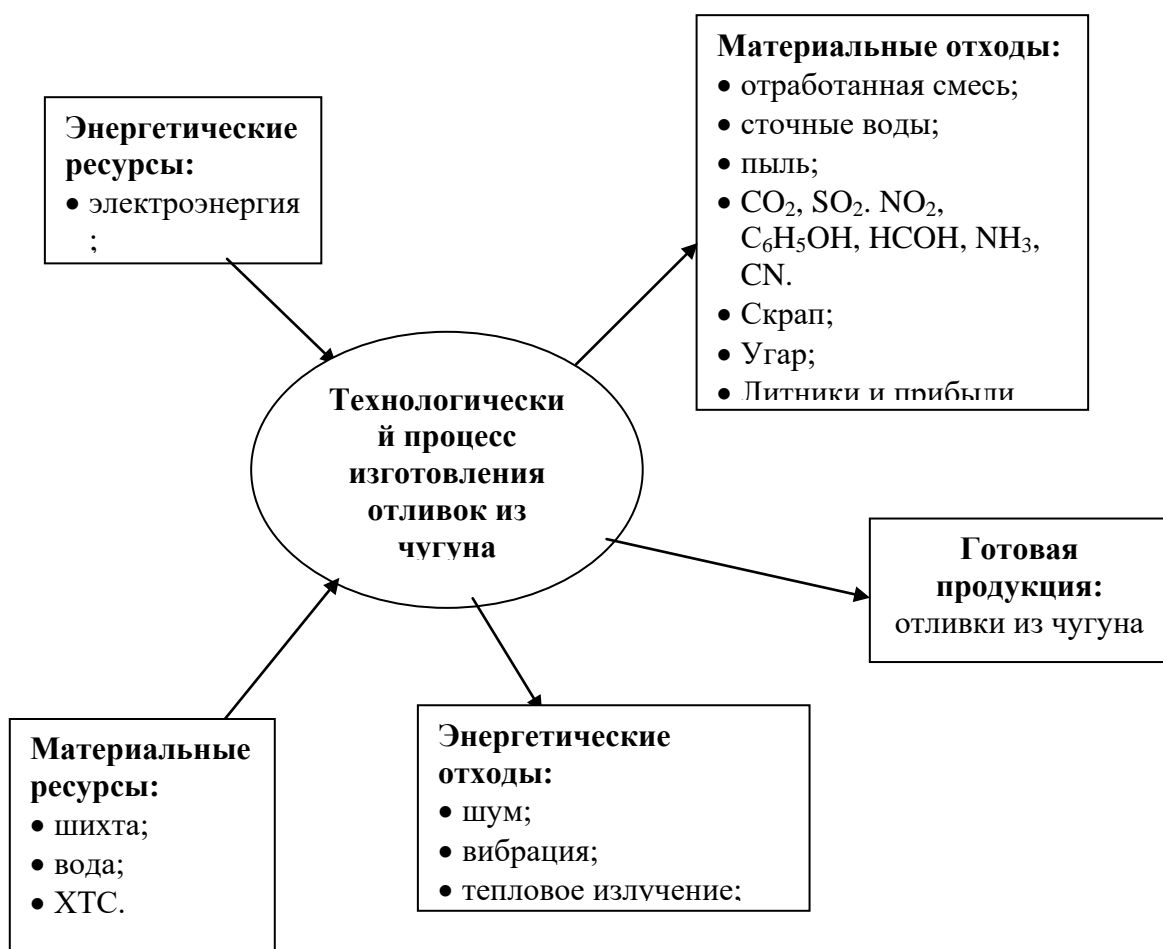
Рисунок 2 – Схема технологического процесса изготовления отливок

Анализ взаимодействия технологического процесса производства отливок с экологическими системами представлен в виде схемы (рисунок 2).