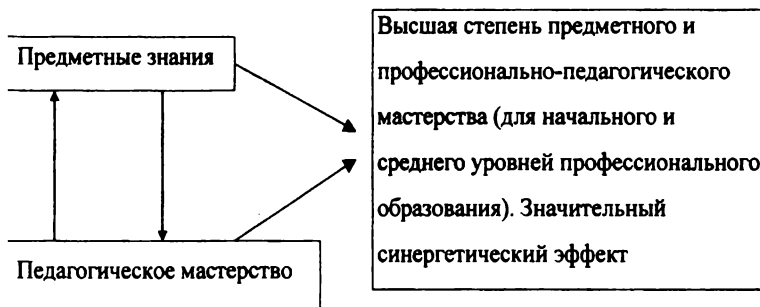
Рис. 1. Схема органичного соединения предметных знаний и педагогического мастерства непосредственно в процессе обучения

Между тем только при третьем варианте возникает и ярко проявляет себя так называемый синергетический эффект как результат взаимодействия глубоких предметных знаний и высокого педагогического мастерства преподавателя. Причем синергетический эффект представляет собой не просто механическое соединение двух эффектов разной природы, а именно следствие их одновременного действия. Схематично это можно представить следующим образом (рис. 1).