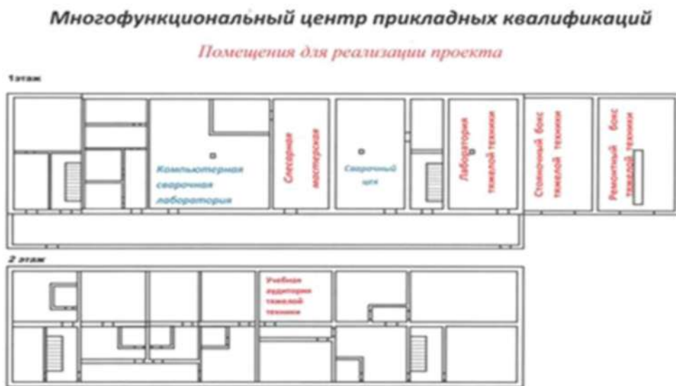
Рис. 2. Материально-техническая база многофункционального центра прикладных квалификаций