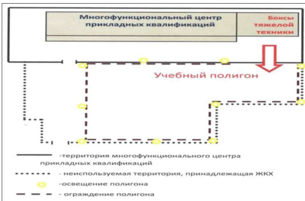
Рис. 3. Схема отвода земли и благоустройства полигона

В данное время ведется работа по получению лицензии востребованных квалификаций в Алданском районе, такие как водитель категории «Д» и «Е», в том числе и профессий, связанных с нефтяной газопромышленностью.