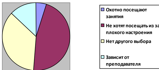
Рис.1 Желание обучающимися посещать занятия

Малое количество учащихся охотно посещают занятия (5%), большинство не хотят посещать занятия из за плохого настроения (46%), другие отметили, что у них нет другого выбора (36%), а у остальных выбор посещения зависит от преподавателя (13%). Из этого можно сделать вывод, что у учащихся нет настроения в связи с напряжённой атмосфере с коллективом и сотрудниками, а также из-за отдалённости семьи от ученика.