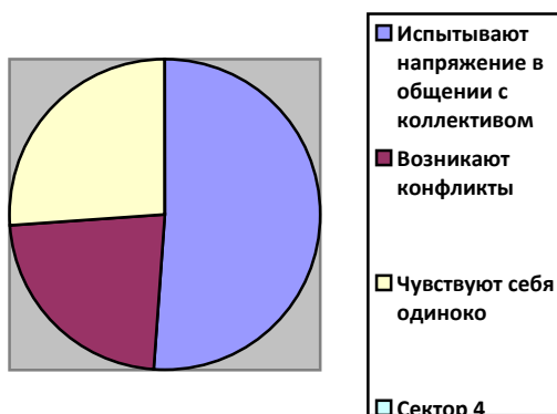
Рис.3 Оценка коллектива обучающимися

Учащиеся оценили ситуацию в коллективе, с которыми они вместе ходят на занятие, и большинство учащихся испытывают напряжение в отношении с коллективом (51%), а то есть они считают, что коллектив у них не дружный и делится на микрогруппы. Остальные поделились на двое. Они считают, что в общении у них часто возникают конфликты (23%) они чувствуют себя одиноко (26%).