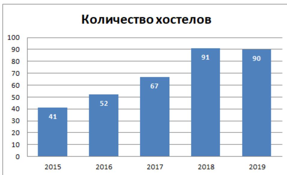
Рис. 1. Динамика развития рынка хостелов Екатеринбурга

Для начала отметим, что количество хостелов в Екатеринбурге к 2019 году заметно возросло, по сравнению с предшествующими годами. На рисунке 1 мы можем увидеть и оценить динамику развития рынка хостелов в городе.