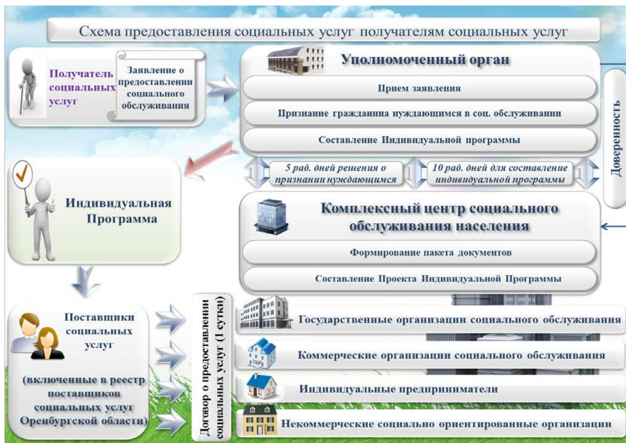
Рисунок 1. Схема предоставления социальных услуг получателям социальных услуг

потребностей, в соответствии с перечнем социальных услуг, предоставляемых поставщиками социальных услуг в Оренбургской области, а также оказания, по их желанию, дополнительных социальных услуг, не входящих в названный перечень.