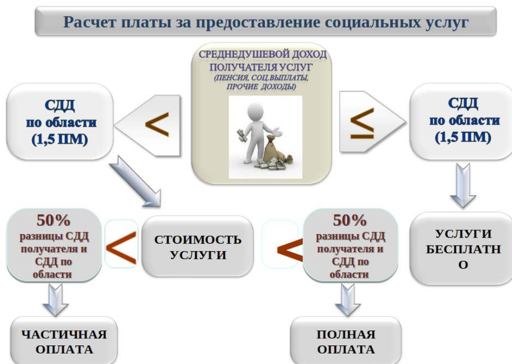
Рисунок 2. Расчет платы за предоставление социальных услуг

Размер ежемесячной платы за предоставление социальных услуг в форме социального обслуживания на дому рассчитывается на основе тарифов на социальные услуги, но не может превышать пятидесяти процентов разницы между величиной среднедушевого дохода гражданина (семьи гражданина) и предельной величиной среднедушевого дохода для предоставления услуг бесплатно 1 .