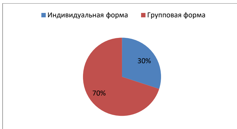
Рисунок 3. Формы социально-психологической коррекции

На вопрос о том, в какой форме проводится социально-психологическая коррекция, 70% специалистов выбрали групповую форму работы и 30% индивидуальную (Рисунок 3). Что касается времени, в течение которого длится коррекционное занятие, то почти все специалисты, а именно 90%, указали менее часа и 10% - 1-1.5 часа.