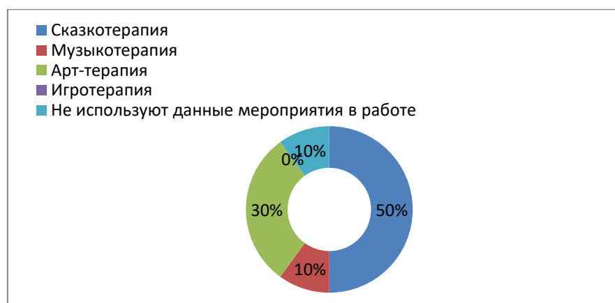
Рисунок 4. Коррекционные мероприятия, проводимые с детьми, испытывающими трудности в социальной адаптации

Такие результаты говорят о том, что данные методы социально-психологической коррекции мало используются специалистами Центра. Связано это, как правило, с тем, что Центр не оснащен необходимыми для такой работы помещениями и оборудованием.