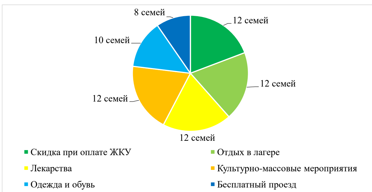
Рисунок 3. Предоставляемая социальная помощь

распространенными вариантами, которые выбирали многодетные семьи, были проблемы медицинского и воспитательного характера – их отметили 4 семьи. Полученный результат позволяет говорить о том, что для всех многодетных семей на сегодняшний день главной проблемой остается материальное обеспечение. Далее по распространенности следуют жилищно-бытовые проблемы и трудности с трудоустройством. Менее значимыми остаются трудности с медицинским обеспечением и вопросами воспитательного характера.