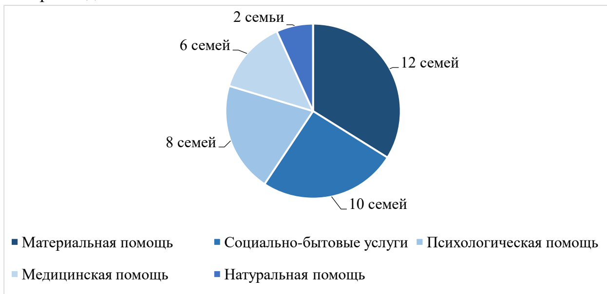
Рисунок 5. Нуждаемость в дополнительной помощи

Следующие два вопроса, на которые ответили респонденты, касались социального контракта. По результатам исследования было выяснено, что социальный контракт заключили 5 семей из 12 опрошенных. При этом 5 семей так же ответили, что оказание помощи на основе социального контракта делает ее качественнее.