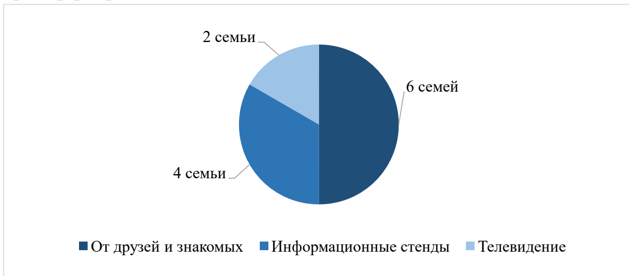
Рисунок 4. Источники, от которых многодетные семьи узнают о мерах социальной поддержки

Следующая задача исследования состояла в том, чтобы выяснить как респонденты оценивают собственную степень информированности о положенных мерах социальной поддержки. 8 респондентов ответили, что проинформированы частично и 4 респондента ответили, что проинформированы полностью.