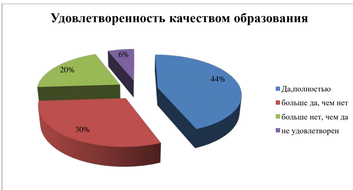
Рис 3. Удовлетворенность качеством образования в школе искусств (в % к числу опрошенных)

На удовлетворенность качеством образования в школе искусств, участники анкеты ответили следующим образом (рисунок 3):