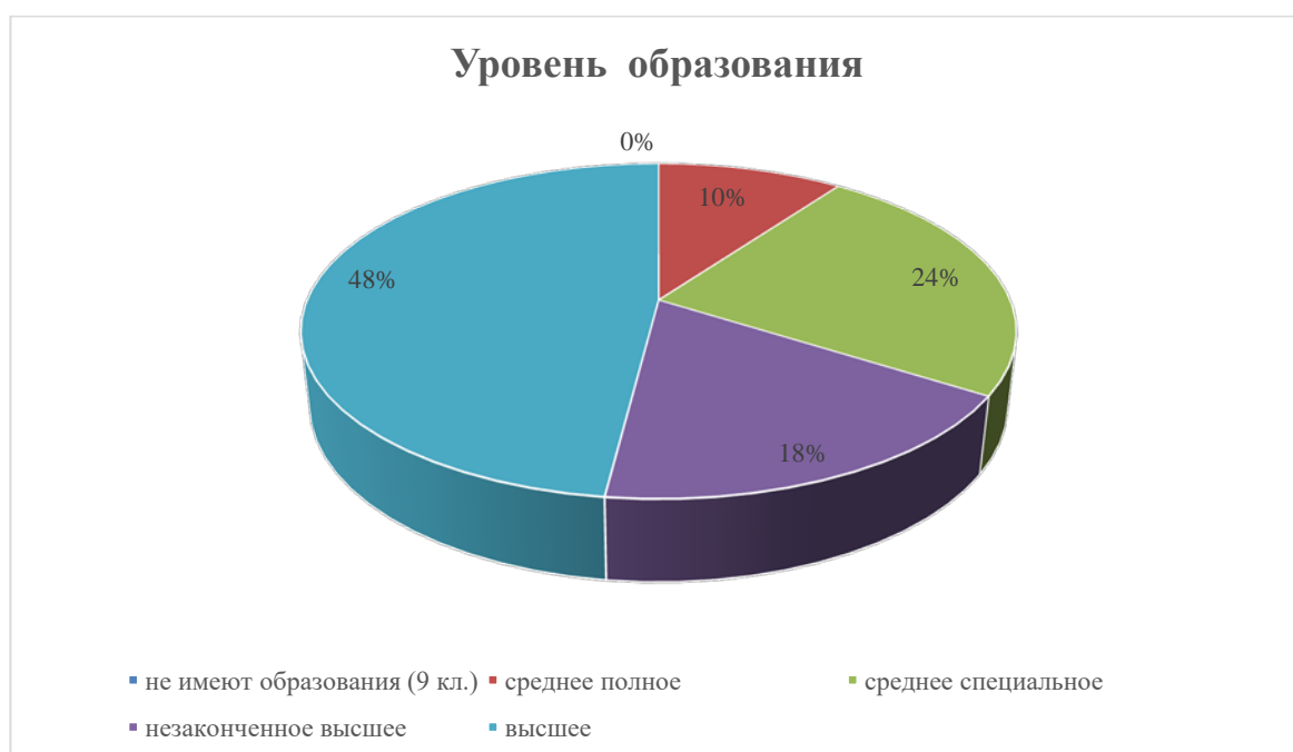
Рис 1. Уровень образования респондентов (в % к числу опрошенных)

На диаграмме, расположенной ниже, показаны результаты на вопрос об уровне образования респондентов (рисунок 1).