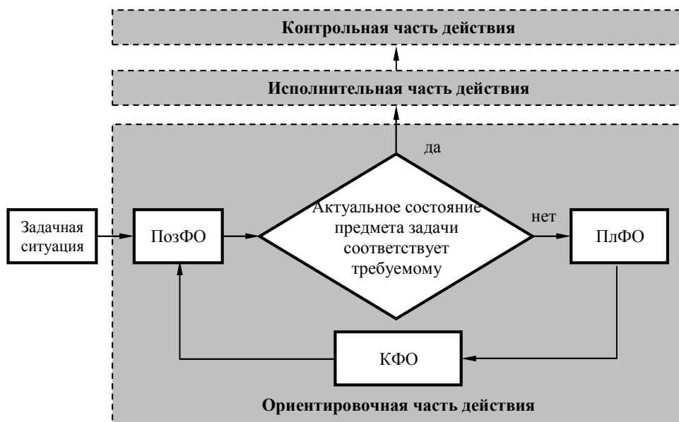
Рис. 3. Структура действия по решению задачи [15] Fig. 3. Structure of action according to the task solution [15]

В соответствии с целями проводимого анализа рассмотрим только ориентировочную часть действия по решению задачи, которая и представляет собой поиск способа решения.