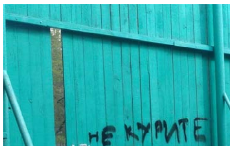
Рис. 6 Fig. 6