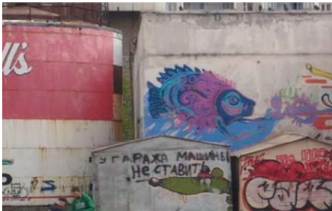
Рис. 7 Fig. 7