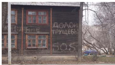
Рис. 13 Fig. 13

Рис. 13 и 14 демонстрируют реализацию функции возмещения: на одном заснято здание барачного типа с лозунгом, сигнализирующим о социальной несправедливости; на другом критике подвергается конкретное профессиональное сообщество.