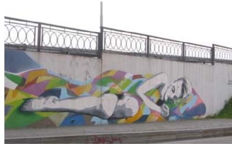
Рис. 8 Fig. 8

Примеры визуальной репрезентации функции управления общественными настроениями Examples of visual representation of functional management of public mood