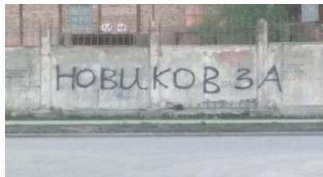
Рис. 10 Fig. 10

Примеры визуальной репрезентации демонстрационно-протестной функции