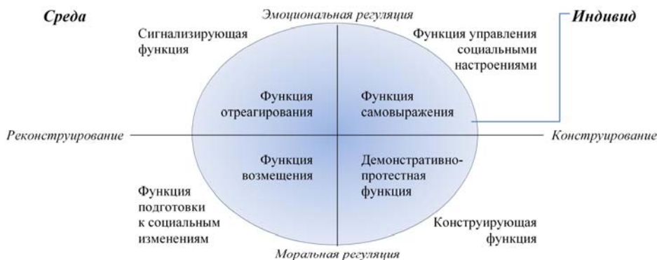
Рис. 17. Модель функций вандализма в пространстве взаимодействия личности и среды

Обобщая все вышеперечисленные функции вандализма, мы построили схему, иллюстрирующую их соотношение по нескольким основаниям (рис. 17).