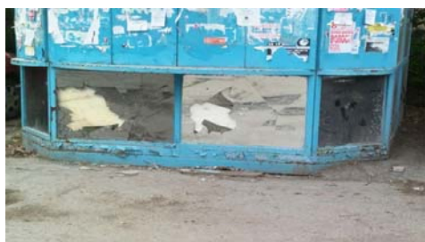
Рис. 11 Fig. 11

Предметы и конструкты, подвергающиеся вандализму, могут быть связаны с источником негативных эмоций (человеком, ситуацией и пр.), а могут вообще не иметь к нему никакого отношения. В последнем случае разрушению либо преобразованию подвергается наиболее доступное пространство. Это могут быть культовые для конкретной субкультуры территории и объекты, места с низкой степенью социального контроля: пустыри, гаражные комплексы, промзоны и т. п. Например, объекты, зафиксированные на рис. 11 и 12, частично разрушены в зонах, доступных для вандала: у одного (торгового павильона) на нижнем уровне разбиты зеркальные поверхности, у второго (рекламы магазина) разорвана поверхность полотна.