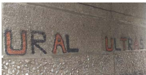
Рис. 3 Fig. 3

Таким образом, посредством вандализма становится возможным разрушение старых и продвижение новых форм работы с прошлым, традиционным и привычным, изменение исторической памяти, формирование новых социальных установок вопреки сложившимся общественным отношениям. Вандализм (особенно направленный против идеологических символов прошлого, ценностно значимых объектов старших поколений или неких аутгрупп) выступает в этом случае антикоммеморационным инструментом, модифицирующим объект в общественном пространстве и приписывающим ему новые значения для последующей его замены новым символом [21].