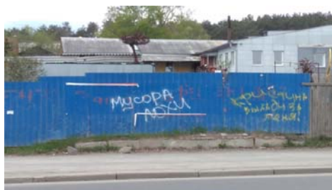
Рис. 14 Fig. 14

Примеры визуальной репрезентации функции возмещения Examples of visual representation of compensative function