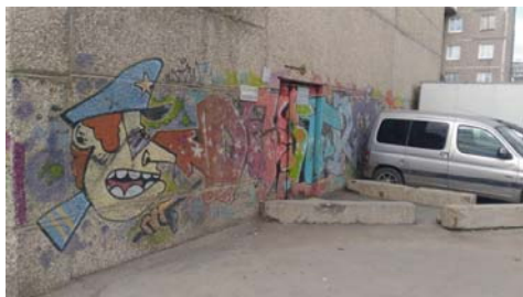
Рис. 9 Fig. 9

вом персонаж-полицейский изображен в сочетании с запретительной табличкой о стоянке машин; второй является стихийной агитацией за политического лидера.