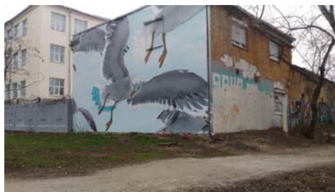
Рис. 15 Fig. 15

Однако не только райтеры используют вандализм в качестве инструмента самовыражения и раскрытия креативного личностного потенциала. К этой модели самореализации могут прибегать другие, обычные горожане. На рис. 15 и 16 приводятся примеры такого материального воплощения творческих способностей: на одной фотографии на торце постройки изображен полет стаи птиц, на другой – дерево как символ жизни.