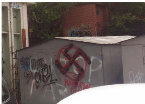
Рис. 1 Fig. 1

Например, на рис. 1 и 2 представлено «заочное» сражение двух политических идеологий. Данная репрезентация «сигнализирует», во-первых, о том, что две противоборствующие силы вступают в схватку и готовы об этом публично заявлять. Во-вторых, они внимательно наблюдают за действиями своих оппонентов и опровергают их, а вандальные репрезентации других форм городской культуры их просто не интересуют.