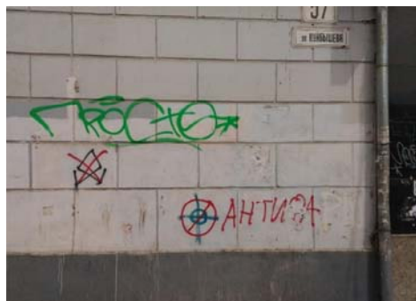
Рис. 2 Fig. 2

Примеры визуальной репрезентации сигнализирующей функции вандализма Examples of visual representation signalling functions of vandalism