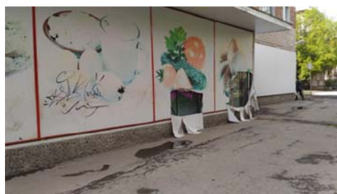
Рис. 12 Fig. 12