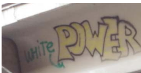
Рис. 4 Fig. 4

Примеры визуальной репрезентации функции подготовки к социальным изменениям