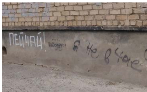
Рис. 5 Fig. 5

Фотографии на рис. 5 и 6 экспонируют варианты сопротивления стереотипному девиантному поведению (алкоголизму) и стремлению пропагандировать с помощью вандальных актов здоровый образ жизни современного горожанина.