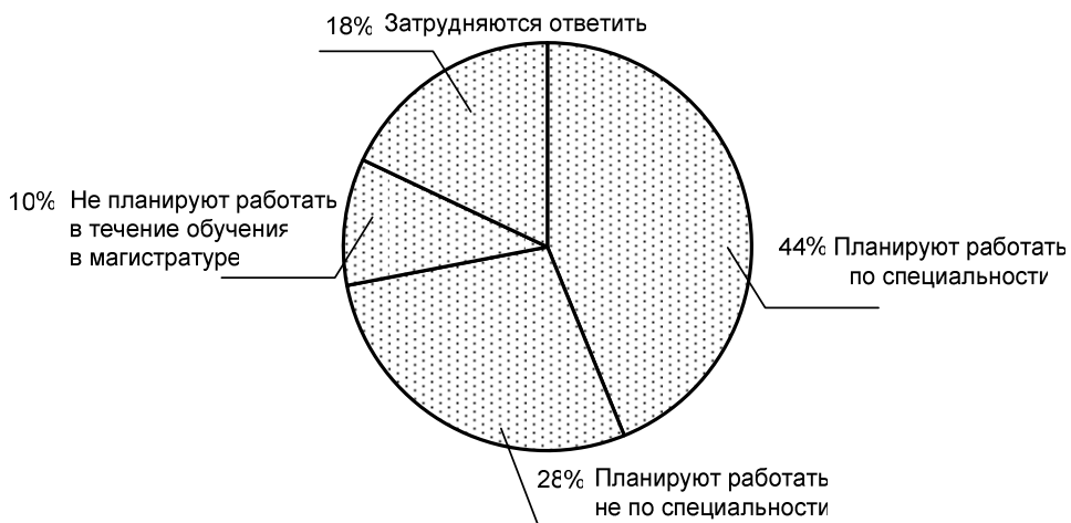
Рис. 4. Планы студентов в отношении трудоустройства после окончания бакалавриата