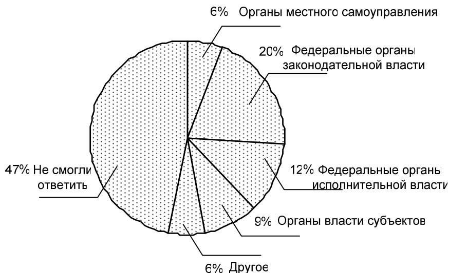
Рис. 3. Организации, в которых студенты 4-го курса направления «ГиМУ» планируют проходить практику

какие-либо государственные корпорации), преимущественно они оперировали общими понятиями («политик», «чиновник», «госслужащий», «управленец»). Другая обнаружившаяся закономерность заключается в том, что большинство учащихся не связывают прохождение практики с последующим местом работы.