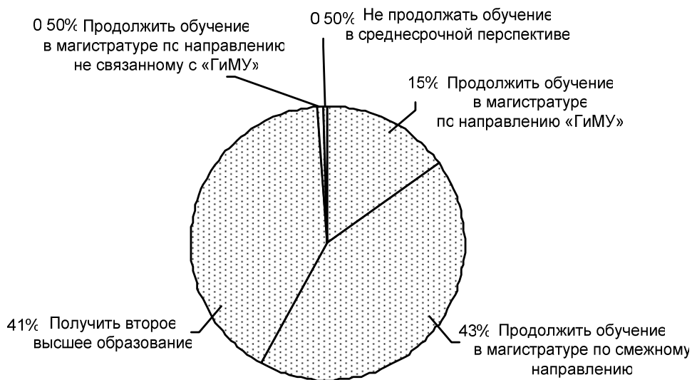
Рис. 6. Планы студентов по продолжению обучения после окончания программ бакалавриата

непривлекательно [3, с. 162]. Главные аргументы, которые приводят как студенты, так и преподаватели, – отсутствие практической направленности и ценности магистерской подготовки, бесполезность чрезмерно теоретизированных знаний, получаемых в магистратуре, часть из которых повторяет материал, уже пройденный в течение четырех лет обучения в бакалавриате. Подобная позиция студентов подкрепляется опросом магистрантов исследуемого направления: лишь 7% из них обучались по направлению «ГиМУ» на бакалавриате, среди респондентов нашлись и такие, кто ранее обучался по технической специальности. Выявленные факты неудивительны: когда единственной целью становится получение диплома, нельзя не воспользоваться шансом приобрести его за 2 года вместо положенных 4–5. Часть студентов, особенно из регионов, считают рациональным выбирать направление обучения исходя из имеющейся у них на определенный момент работы. Можно сделать вывод, что Болонская система не функционирует в нашей стране должным образом: искажается суть всей системы высшего образования, что делает нерентабельными вложения государства в организационные мероприятия, связанные с переходом к подобной концепции профессиональной подготовки.