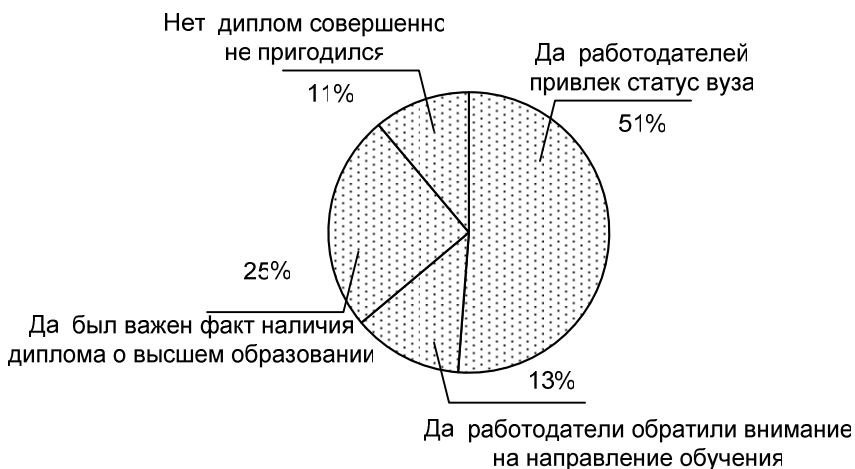
Рис. 1. Оценка выпускниками важности диплома при трудоустройстве

Один из первых вопросов, задаваемых выпускникам, был связан с их оценкой значимости диплома о высшем образовании для работодателей (рис. 1). Опыт почти всех респондентов свидетельствует: имеющийся диплом является очевидным преимуществом при приеме на работу. Более половины указали на престиж вуза в глазах работодателей и их высокое мнение о конкретном учебном заведении. Однако лишь малая часть респондентов отметила, что существенную роль в их трудоустройстве сыграло получение образования именно по направлению «ГиМУ».