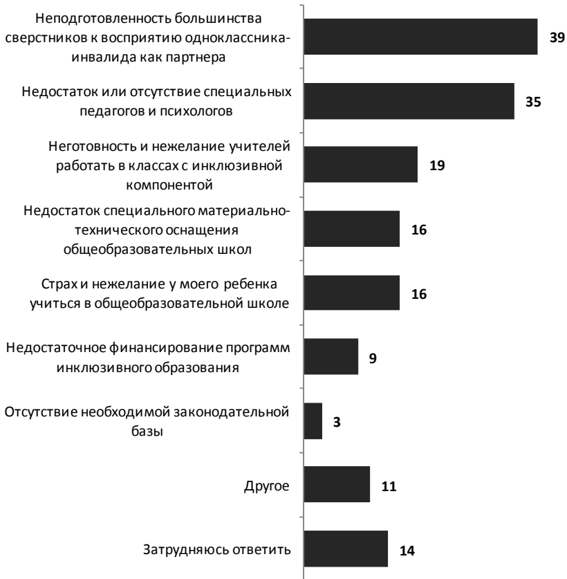
Рис. 2. Препятствия на пути инклюзии ребенка с ОВЗ, % от числа опрошенных родителей детей из коррекционных школ 1