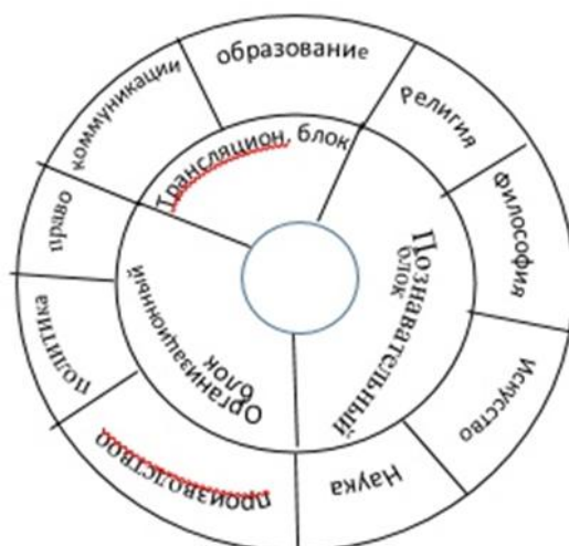
Рисунок 2. Схема основных институтов культуры

Образование является одним из основных, базовых институтов культуры. Именно институт образования, действуя систематически, взаимосвязанно и постоянно обеспечивает воспроизводство и развитие общества путем организованной передачи социального опыта в виде знаний, умений, навыков [5]. Взаимосвязь культуры и образования показана на рисунке 3.