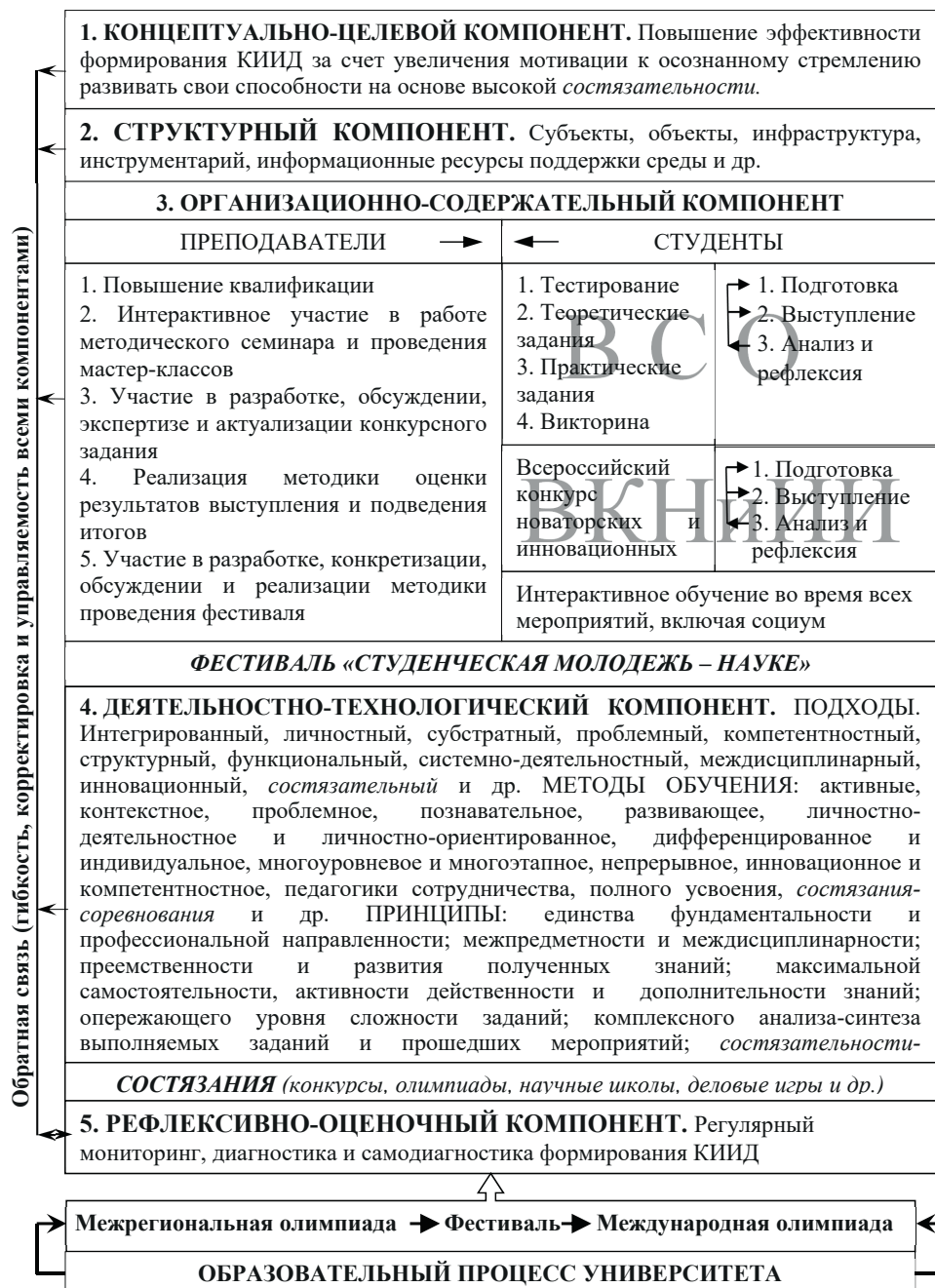
Рис. 1. Модель конкурентной образовательной среды Fig. 1. Model of a competitive educational environment