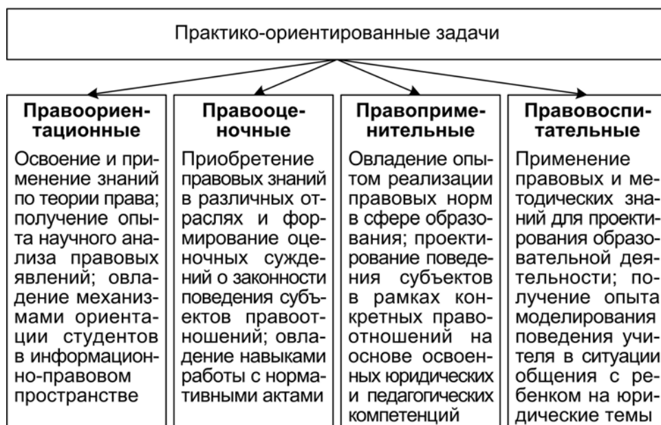
Рис. 2. Классификация задач по функциональной направленности

В комплекс следует включить задачи, отличающиеся по функциям, содержанию, алгоритму решения и степени трудности (рис. 2) [1].