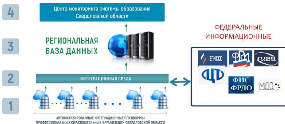
Рис. 2. Составляющие информационной системы «Единое цифровое пространство»

ловской области, подсистемой автоматизации среднего профессионального образования) (рис. 2).