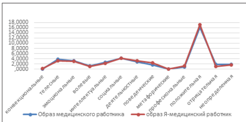
Рисунок 1. Графическое представление «Образ медицинского работника» и образа «Я-медицинский работник» по методике СОЧ(и), 1 курс (медиана)

Исследование «Образ медицинского работника» и образа «Я – медицинский работник» по методике СОЧ(и) представлены на рисунке 1.