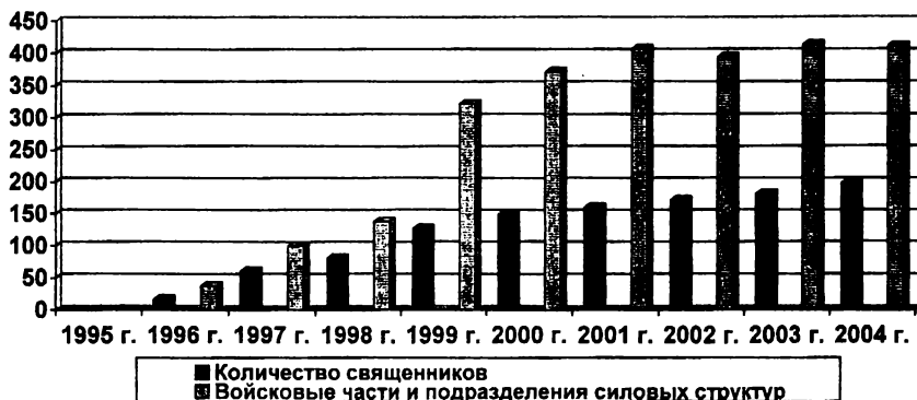
Динамика развития строительства православных храмов, создания молитвенных комнат в войсковых частях и подразделениях силовых структур по состоянию на 25.05.2004 г.