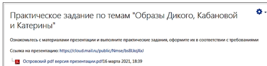
Рисунок 3. Пример размещения практической работы по изученной теме

В процессе освоения лекционного материала обучающиеся выполняют тестовые задания после каждой лекции (рис. 4)