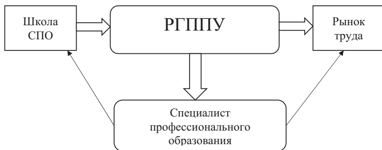
Рис. 1. Роль РГППУ в подготовке кадров для СПО

С данной задачей успешно справляется РГППУ, который на протяжении многих лет осуществляет организацию высококачественных образовательных услуг для обеспечения потребностей региональных систем СПО (в частности, Омской, Кемеровской, Челябинской, Свердловской областей, Пермского края, ХМАО и т. д.). Структурой, которая осуществляет взаимодействие всех элементов динамично развивающейся системы «вуз – СПО – производство», выступает институт развития территориальных систем.