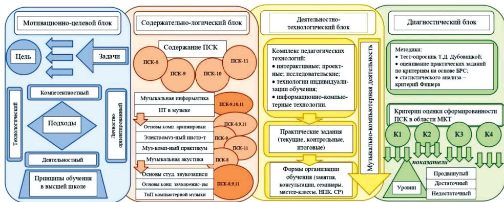
Рис. 1. Структурно-функциональная модель профильной подготовки специалистов в области музыкально-компьютерной деятельности

Разработанная авторами структурно-функциональная модель профильной подготовки специалистов в области музыкально-компьютерной деятельности, не имеющая аналогов в мировой науке и практике, содержит четыре блока: мотивационно-целевой, содержательно-логический, деятельностно-технологический и диагностический (оценочно-результативный) (см. рис. 1).