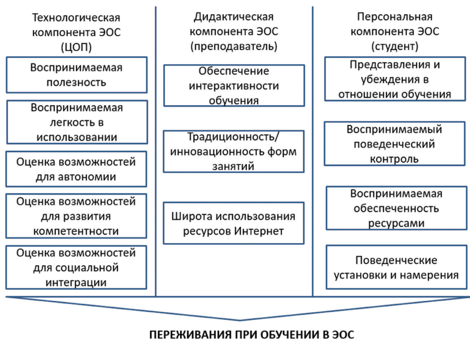
Рис. 1. Исследовательская модель влияния ЭОС на переживания обучающихся

На основе синтеза основных положений рассмотренных подходов к объяснению поведения обучающихся в ЭОС, мы можем схематически представить модель переживаний обучающегося в отношении ЭОС следующим образом (см. рис. 1).