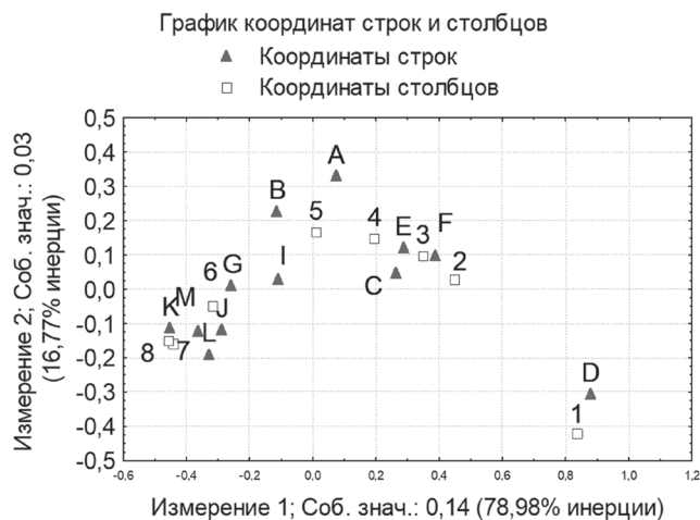
Рис. 3. Карта соответствий различных видов учебной активности студентов и оценок изменения количества времени, отведенного на их реализацию (Условные обозначения: 1 – не применимо ко мне (не делал этого раньше, не делаю сейчас); 2 – существенно уменьшилось; 3 – уменьшилось; 4 – скорее уменьшилось; 5 – практически не изменилось; 6 – скорее увеличилось; 7 – увеличилось; 8 – существенно увеличилось; А – Посещение занятий (очно или дистанционно); В – Выполнение контрольных и проверочных работ; С – Выполнение лабораторных работ, опытов; D – Участие в различных студенческих состязаниях; E – Участие в групповых дискуссиях и обсуждениях; F – Дополнительные консультации у преподавателя; G – Выполнение письменных работ в рамках самостоятельной работы; I – Выполнение творческих работ; J – Поиск и просмотр учебных видео на Youtube, Rutube или других видеохостингах; K – Поиск текстовой учебной информации в сети Интернет с помощью поисковых систем; L – Использование вузовских сервисов для поддержки обучения студентов; M – Посещение сайтов образовательной тематики для самоподготовки по учебным предметам)