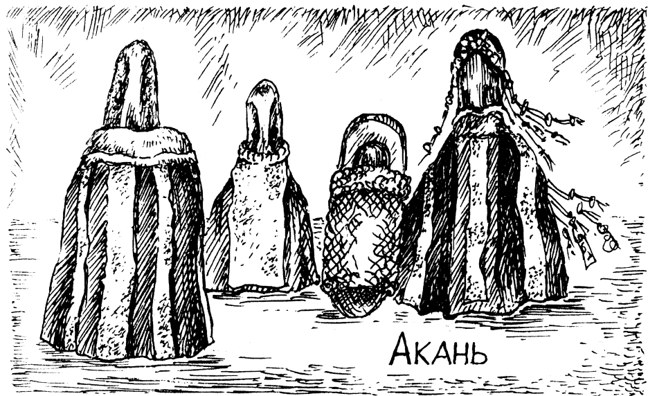
Рис. 2. Куклы