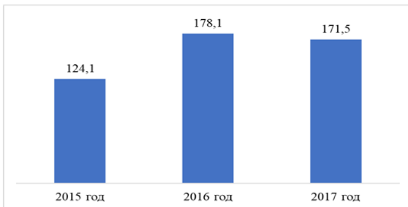
Рисунок 3. Расходы бюджета на дополнительное образование по главному распорядителю «Управление образования» (2015-2017 гг.), млн. руб.

разования. Расходы бюджета на дополнительное образование по главному распорядителю «Управление образования» также имеют неустойчивую тенденцию, однако это связано с изменением основного вида деятельности и утраты статуса образовательной организации муниципальным автономным учреждением дополнительного образования «Специализированная детско-юношеская спортивная школа олимпийского резерва г. Советский» (Рисунок 3) [8,9,10].