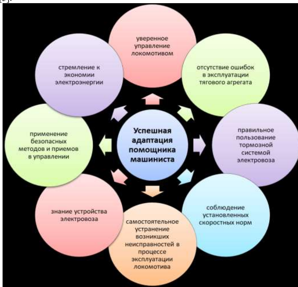
Рисунок 3 – Условия успешной адаптации помощника машиниста

На рисунке 3 представлены признаки успешной адаптации помощника машиниста электровоза в условиях АО «ЕВРАЗ Качканарский горно-обогатительный комбинат» [5].