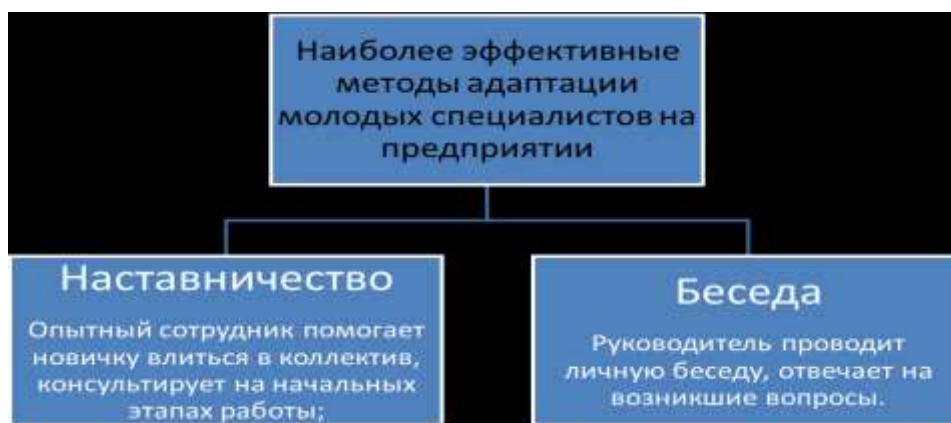
Рисунок 2 – Наиболее эффективные методы адаптации

Также важно контролировать индивидуальную коммуникацию новичка и руководителя. Молодой специалист всегда должен знать, что думает руководитель о его работе. Важно, чтобы коммуникация в данном случае работала в двух направлениях. Сотрудник со своей стороны должен правильно реагировать на замечания, прислушиваться к ним.