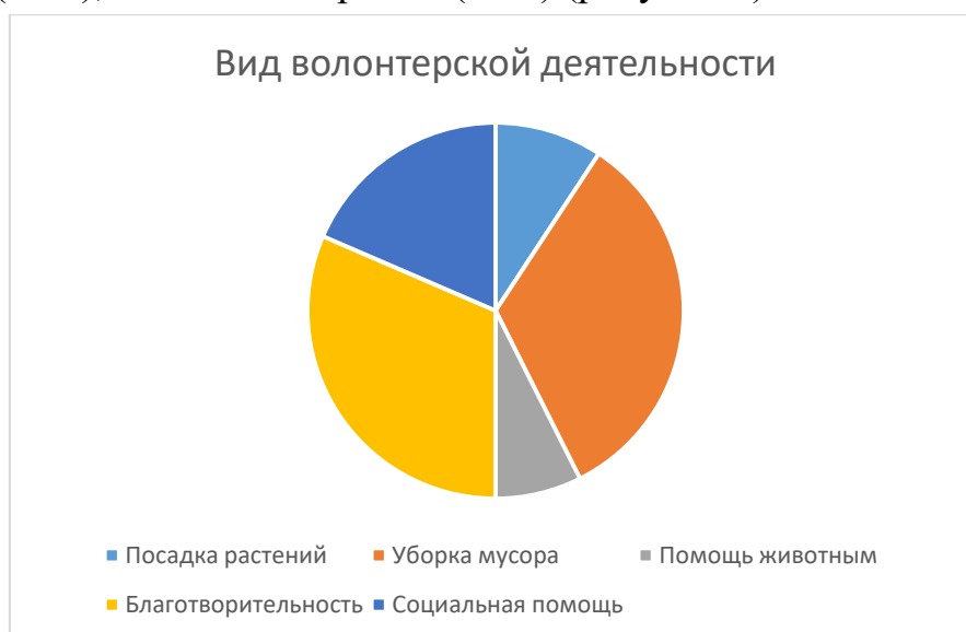
Рисунок 2 – Популярность видов волонтерской деятельности среди студентов ГАПОУ СО «Уральский железнодорожный техникум» г. Красноуфимска

Наиболее популярными видами добровольной деятельности, в которых принимали участие студенты, оказались: посадка растений (10%), уборка мусора (36%), помощь животным (8%), благотворительность (сбор средств) (34%), помощь ветеранам (20%) (рисунок 2).