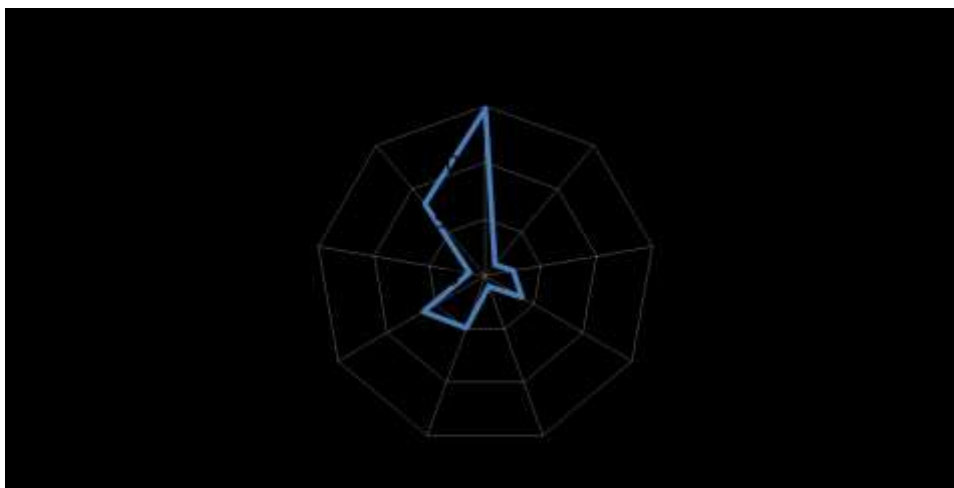
Рисунок 4 – Какими личными качествами должен обладать доброволец?

Анализируя полученные данные, приходим к выводу, что основными качествами личности, которыми должен обладать доброволец, являются (в порядке убывания): доброта, любовь к людям/животным, терпение, радость и стрессоустойчивость.